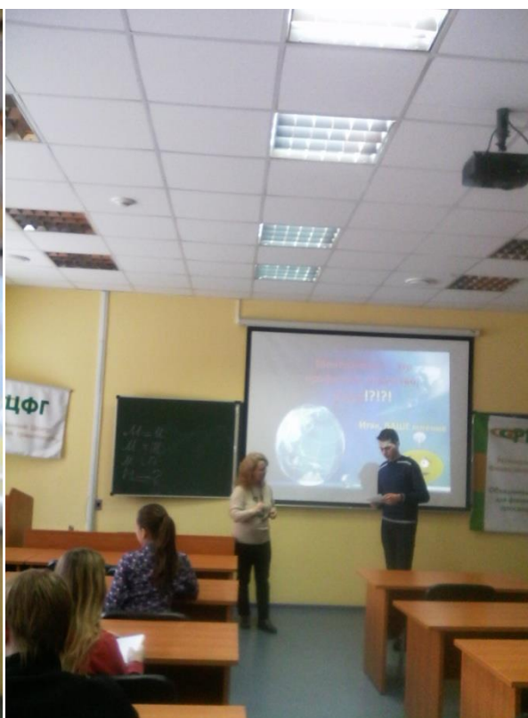
Аргументы, защита, оценки...