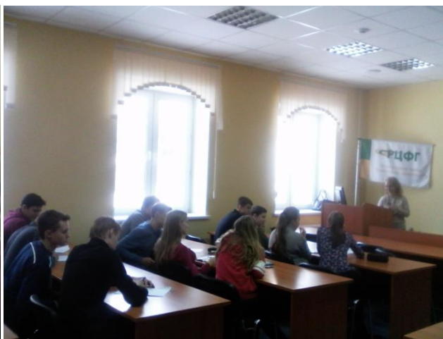
Лекции, вопросы, обсуждения...